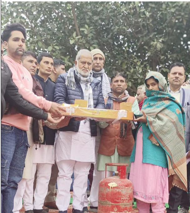
जिला कैथल के गांव सजूमा में विधायक श्री लीला राम विकसित भारत संकल्प यात्रा जनसंवाद के तहत आयोजित जागरूकता कार्यक्रम में लाभार्थी को प्रधानमंत्री उज्वला योजना के तहत एलपीजी गैस कनेक्शन देते हुए।