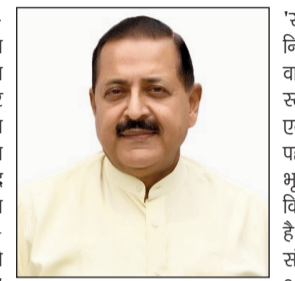
डॉ जितेंद्र सिंह

सौख्ये की संस्कृति को, समय-समय पर होने वाली और केवल नियमों के पालन तक सीमित प्रक्रिया से बदलकर, एक निरंतर चलने वाली, भूमिका-आधारित और स्वयं-निर्देशित विकास यात्रा में रूपांतरित करना इसका मकसद है। जैसा कि आयोग इसका वर्णन करता है, यह बदलाव 'कर्मचारी'-यानी निम्नो का पालन करने वाले एक पारदर्शिक 'कर्मयोगी' बनने की ओर है: एक ऐसा लोक सेवक जो किसी उद्देश्य, सेवा-भाव और उत्कृष्टता से अनुरूप एक सुव्यवस्थित कार्यकुशलता आधारित पाठ्यक्रम मिल जाता है। यह शासक तक सूचनाओं और आत्मनिश्चय से लैस होकर योजना के लाभार्थियों की पहली बैठक की अध्यक्षता कर रहा होता है। यह बदलाव देखने में छोटा लग सकता है मगर हकीकत में किसी क्रांति से कम नहीं है। एक राजस्व निरीक्षक, पुणे में एक शहरी-अध्यापित शुरू किया गया मिशन कर्मयोगी एक क्रांति ला रहा है। यह ना भारत के लिए एक नई तरह के प्रशासनिक अधिकारी तैयार करने के उद्देश्य से चुनाया काम कर रहा है।