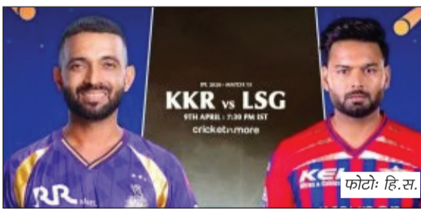
हैं तथा वह ईडन गार्डन्स की परिस्थितियों का भरपूर फायदा उठाने की कोशिश करेंगे। केकेआर ने अभी तक तीन मैचों में जीत हासिल नहीं की है। यहां की पिच तेज गेंदबाजों के लिए मददगार हो सकती है। बारिश के कारण रद्द कर दिए गए पिछले मैच में पंजाब किंग्स के ऑस्ट्रेलियाई तेज गेंदबाज जेविअर बार्टलेट ने दिखाया कि अधिक घास वाली पिच पर सीधी सीम गेंदबाजी कितनी प्रभावी हो सकती है। उन्होंने तीन गेंद के अंदर फिन एलन और कैमरन ग्रीन को आउट करके केकेआर के शीर्षक्रम को ध्वस्त कर दिया था। केकेआर भाग्यशाली रहा कि यह मैच बारिश के कारण रद्द कर दिया गया। इससे उसने अंक

ईडन गार्डन्स में लखनऊ सुपर जायंट्स से भिड़ेंगी कोलकाता