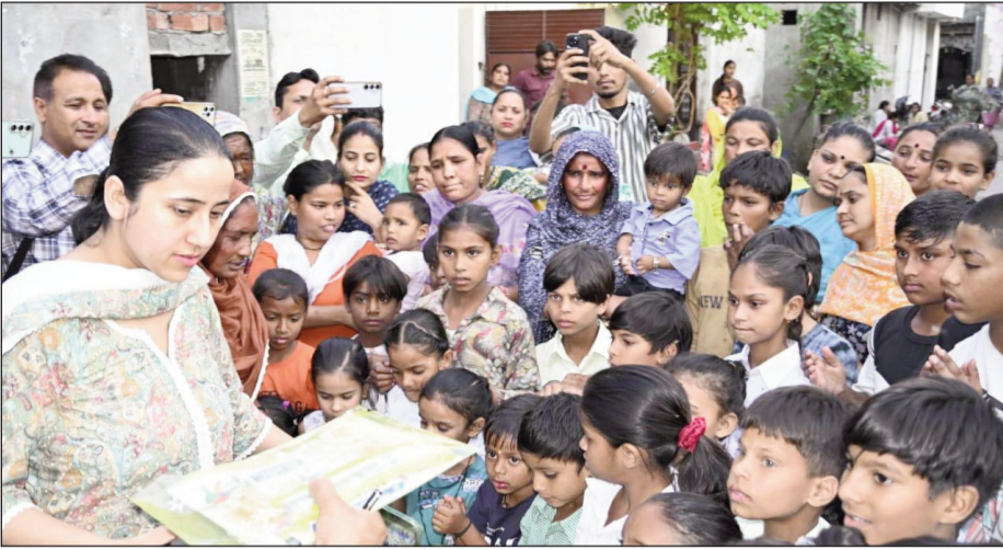
गिरफ्तारियां संभव हो सकीं। चुनौतियों पर उन्होंने कहा, हम साक्ष्य-आधारित पुछताछ करते हैं और दबाव में भी शांत रहते हैं। समय की संवेदनशीलता और जानकारी की कमी

साथ महिला अधिकारियों ने संचालन और प्रशासनिक दोनों क्षेत्रों में अपनी क्षमता सिद्ध की है। वे तकनीकी रूप से दक्ष हैं और अपराध रोकथाम के आधुनिक तरीकों से भली-भांति परिचित हैं। एसएसपी फरीदकोट प्रजा जैन ने जोर देकर कहा कि आधुनिक पुलिसिंग लिंग के बजाय योग्यता और समन्वय पदों पर कार्यरत है। पुलिस रिकॉर्ड के अनुसार इनमें 4 एसडीजीपी, 1 एडीजीपी, 2 आईजीपी/सीपी, 2 डीआईजी, 18 एसएसपी/एआईजी/कमांडेंट (जिनमें 3 एसएसपी), 23 एसपी, 1 एसपी और 28 डीएसपी महिला अधिकारी शामिल हैं। कुल 79 में से 5 अधिकारी फील्ड पदों की अगुवाई कर रही हैं, जहां वे गैंगस्टरों पर वार जैसी मुहिमों में सक्रिय भागीदारी निभा रही हैं। मजबूत शिक्षा और प्रशिक्षण के