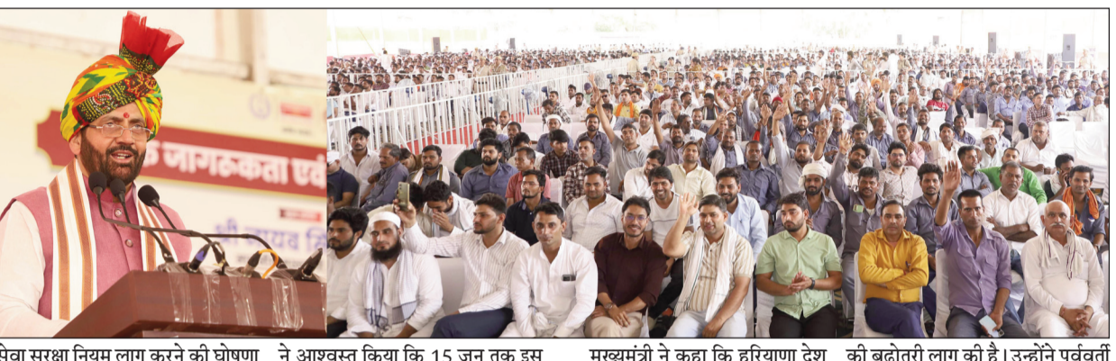
सेवा सुरक्षा नियम लागू करने की घोषणा पहले ही की जा चुकी है, जिसके तहत कर्मचारियों को नियुक्ति पत्र जारी करने की प्रक्रिया वर्तमान में जारी है। मुख्यमंत्री ने आश्वस्त किया कि 15 जून तक इस प्रक्रिया को पूर्ण करते हुए सभी पात्र कर्मचारियों को नियुक्ति पत्र प्रदान कर दिए जाएंगे।

श्रमिक जागरूकता एवं सम्मान समारोह को संबोधित कर रहे थे। इस अवसर पर हरियाणा के उद्योग एवं वाणिज्य मंत्री राव नरबीर सिंह बतौर विशिष्ट अतिथि उपस्थित रहे। मुख्यमंत्री ने भारतीय मजदूर संघ द्वारा ऑटो चालकों एवं ड्राइवर्स के लिए श्रम कल्याण बोर्ड के गठन की मांग पर घोषणा करते हुए कहा कि राज्य सरकार संश्लिष्ट श्रमिकों के सामाजिक एवं आर्थिक विकास के लिए राज्य सामाजिक सुरक्षा बोर्ड का गठन करेगी। इस बोर्ड के माध्यम से ऑटो चालक एवं ड्राइवर्स को भी सामाजिक सुरक्षा का लाभ प्रदान किया जाएगा। उन्होंने कहा कि सरकार द्वारा