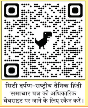
सिटी दर्पण-राष्ट्रीय दैनिक हिंदी समाचार पत्र की अधिकारिक वेबसाइट पर जाने के लिए स्कैन करें।

आज का विचार शब्द और व्यवहार ही मनुष्य की असली पहचान है, चेहरा और हैसियत का क्या है, आज है कल नहीं है।