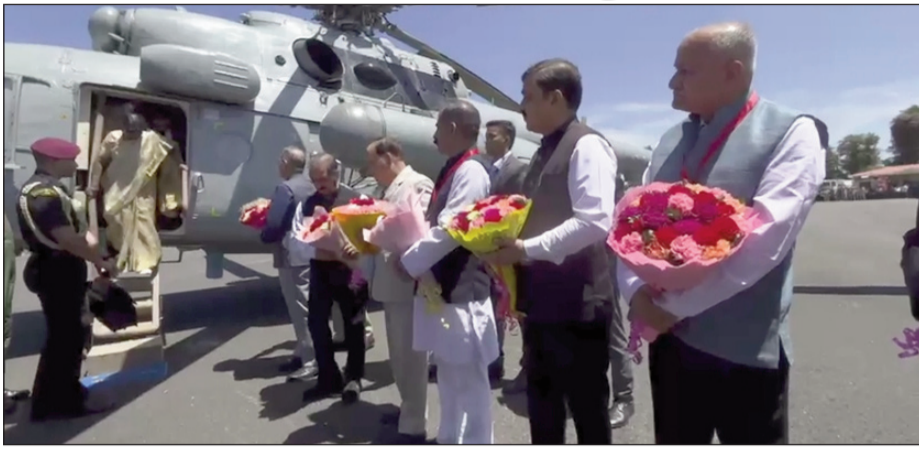
ग्रीष्मकालीन प्रवास का हिस्सा है, जो 27 अप्रैल से 1 मई तक चलेगा।

शिमला पहुंचने के बाद राष्ट्रपति सीधे मशहोबरा स्थित राष्ट्रपति निवास के लिए रवाना हो गईं, जहां वे अपने प्रवास के दौरान ठहरेंगी। यह दौरा राष्ट्रपति के