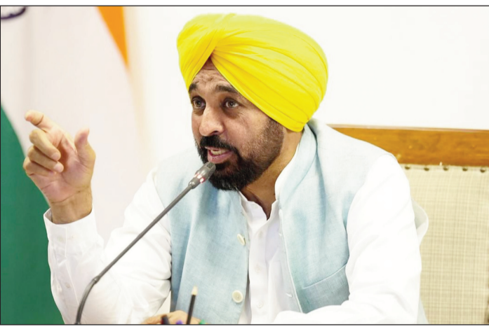
पानी छोड़ने की योजना बनाई जानी चाहिए। शुरू की जा रही है, इसलिए आगामी मानसून में पानी को ध्यान में रखते हुए खाइड डैम से