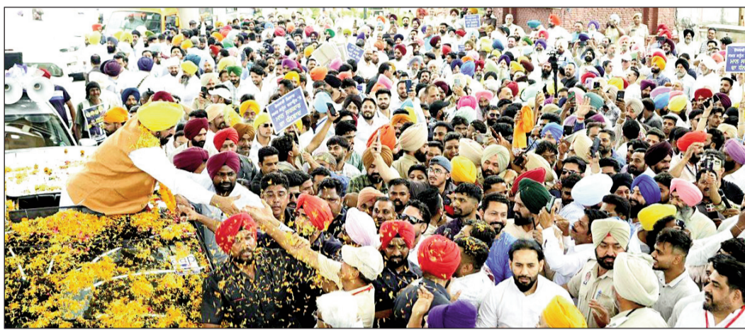
कब्जा करने की साजिश और आम आदमी हैं। मुख्यमंत्री भगवंत सिंह मान ने कहा कि क्लोनिकों को बंद करने की कोशिशें की जा रही भाजपा नफरत और फूट डालो राजनीति पर भाजपा के बीच कोई भी नया गठजोड़ एक बार

श्रुक्राना यात्रा के दूसरे दिन रईआ और अन्य स्थानों पर जनसभा को संबोधित करते हुए मुख्यमंत्री भगवंत सिंह मान ने कहा कि भाजपा की पंजाब विरोधी मानसिकता कई बार सामने आ चुकी है। उन्होंने कहा कि किसान आंदोलन के दौरान 700 किसानों की मौत हुई, पंजाब की झाकियों को रोकने की कोशिशें की गईं, बीबीएमवी के जरिए पंजाब के पानी को जबरन हरियाणा को देने की कोशिशें, पंजाब यूनिवर्सिटी को छीने की साजिश, चंडीगढ़ पर