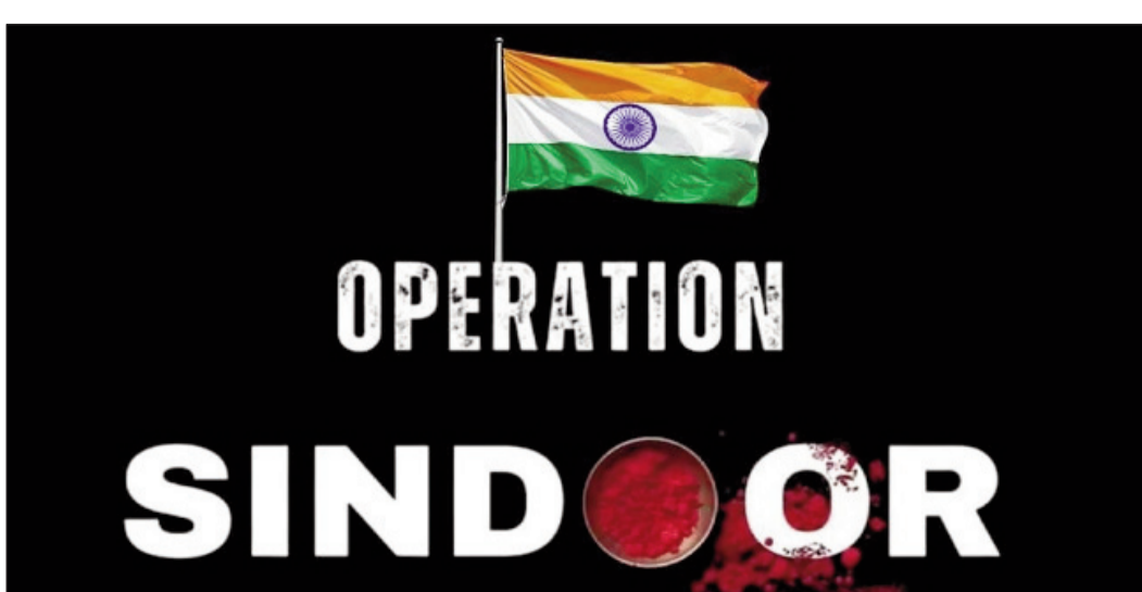
सूक्ष्म रणनीति और दृढ़ राजनीतिक इच्छाशक्ति के रूप में याद रखेगा। उन्होंने कहा कि यह अभियान दुश्मनों के लिए स्पष्ट संदेश है कि वे बच नहीं सकते। रक्षा मंत्री राजनाथ सिंह ने कहा कि ऑपरेशन सिंदूर के दौरान सशस्त्र बलों ने कहीं भी छिप जाएँ, भारत की नजर और प्रहार से कि ऑपरेशन सिंदूर के दौरान सशस्त्र बलों ने

केंद्रीय गृह एवं सहकारिता मंत्री अमित शाह ने कहा कि ऑपरेशन सिंदूर भारत का एक युगांतरकारी मिशन है, जो दुश्मनों को भारतीय सशस्त्र बलों की अचूक मारक क्षमता की याद दिलाता रहेगा। इतिहास इस दिन को भारतीय सेना की सटीक कार्रवाई, खुफिया एजेंसियों की