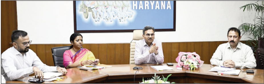
सामाजिक संगठनों ने भाग लिया।

मुख्य सचिव आज यहाँ ह्यमाता-पिता एवं वरिष्ठ नागरिक भरण-पोषण और कल्याण अधिनियम, 2007 तथा ह्यहरियाणा माता-पिता एवं वरिष्ठ नागरिक भरण-पोषण एवं कल्याण नियम, 2009 पर आयोजित राज्य स्तरीय कार्यशाला की अध्यक्षता कर रहे थे। सामाजिक न्याय, अधिकारिता, अनुसूचित जाति एवं पिछड़े वर्ग कल्याण तथा अल्पोद्य (सेवा) विभाग द्वारा आयोजित इस कार्यशाला में उपायुक्तों, उपमंडल अधिकारियों (एसडीएम), विधि विशेषज्ञों तथा प्रदेशभर में वरिष्ठ नागरिकों के कल्याण से जुड़े कई