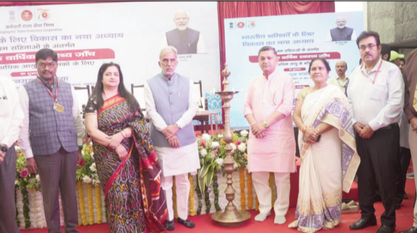
विभाग के अधिकारियों को फिल्ट्र में लगातार विजिट करने के निर्देश दिए।

उपायुक्त विश्राम कुमार मीणा बुधवार को लघु सचिवालय एनआईसी वीडियो कॉन्फ्रेंस हॉल में कृषि विभाग के अधिकारियों के साथ आयोजित फानों (फसल अवशेष) जलाने की घटनाओं को समाप्त करने की दिशा में कार्य योजनाओं की समीक्षा बैठक की अध्यक्षता कर रहे थे। उन्होंने कृषि