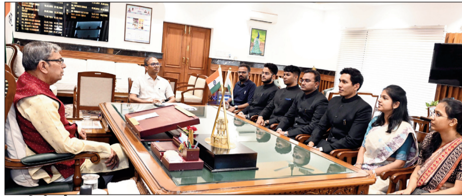
सिटी दर्पण संवाददाता