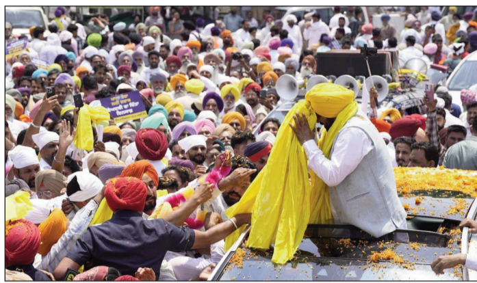
खिलाफ एकजुट होने आह्वान किया।

रची जा रही है, जहां सांप्रदायिक ताकतों समाज के धुत्तीकरण और सत्ता पर कब्जा करने के लिए भाईचारों को एक-दूसरे के खिलाफ खड़ा करने की कोशिश कर रही हैं। मुख्यमंत्री ने जोर देकर कहा कि देश की आजादी और एकता के लिए सबसे ज्यादा कुर्बानियां देने वाले पंजाबी ऐसी ताकतों को मुंह तोड़ जवाब देंगे। इस मौके पर मुख्यमंत्री ने कहा कि बेअदबी के मामलों में शामिल लोगों, जिनमें सरपरस्त भी शामिल हैं को अब नए कानून के तहत सख्त सजाएं भुगतनी पड़ेंगी, जिसमें उम्रकैद और 50 लाख रुपए तक का जुर्माना शामिल है। तलवंडी साबो, बटिंडा शहर और कोटशमीर में विशाल जनसभा को संबोधित करते हुए मुख्यमंत्री भगवंत सिंह मान ने पंजाबियों को राज्य की शांति, भाईचारे और सद्भावना के लिए घातक फूट डालो ताकतों के