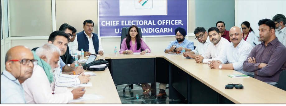
ट्रिटरहित एवं विश्वसनीय मतदाता सूची तैयार करने के लिए यह गहन पुनरीक्षण आवश्यक हो गया है। अर्हता तिथि 01.07.2026 निर्धारित की गई है।

बैठक के प्रारंभ में मुख्य निर्वाचन अधिकारी ने बताया कि चंडीगढ़ में अंतिम गहन पुनरीक्षण वर्ष 2002 में किया गया था। तीव्र शहरीकरण, निरंतर प्रवासन, 18 वर्ष की आयु प्राप्त कर मतदाता बनने वाले नए युवा नागरिकों की संख्या में वृद्धि, मृत्यु संबंधी सूचनाओं के समय पर प्राप्त न होने तथा अवैध विदेशी नागरिकों के नाम मतदाता सूची में शामिल होने जैसी परिस्थितियों को देखते हुए