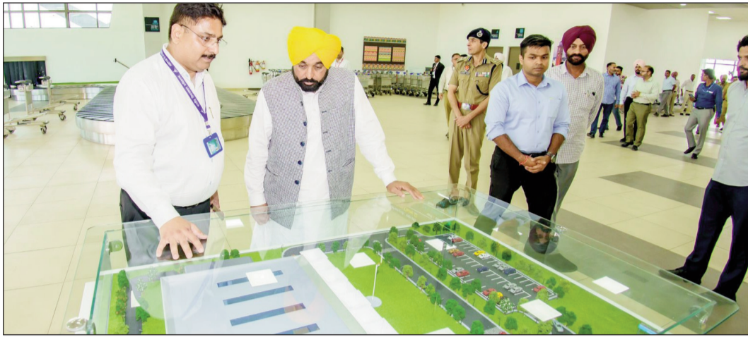
मामले को केंद्र सरकार के समक्ष उठाएंगे। हवाई अड्डे के दौर के दौरान लोगों से

पंजाब सरकार द्वारा हवाई अड्डे के विकास पर लगभग 54.67 करोड़ रुपये खर्च करने की बात कहते हुए मुख्यमंत्री भगवंत सिंह मान ने कहा कि हलवारा से नियमित उड़ानें शुरू होने से न केवल पंजाब के लोगों को बड़ी सुविधा मिलेगी, बल्कि प्रांत में औद्योगिक निवेश और व्यापारिक गतिविधियों के लिए भी नए रास्ते खुलेंगे। स्वतंत्रता सेनानियों और महान सतों की विरासत का सम्मान करने की सरकार की प्रतिबद्धता दोहराते हुए मुख्यमंत्री ने कहा कि अथक प्रयासों के कारण मोहाली एयरपोर्ट का नाम शहीद भगत सिंह और आदमपुर एयरपोर्ट का नाम श्री गुरु रविदास महाराज जी के नाम पर रखे जाने के बाद अब हलवारा एयरपोर्ट का नाम शहीद करतार सिंह सराभा के नाम पर रखा जाना चाहिए। उन्होंने आगे कहा कि वे इस