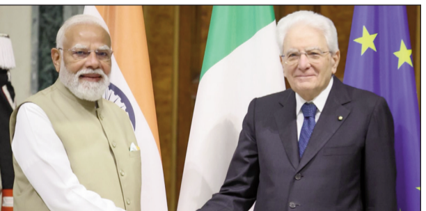
स्थायी साझेदारी की पुष्टि की और विभिन्न क्षेत्रों पर चर्चा की। उन्होंने व्यापार, प्रौद्योगिकी, नवाचार, स्वच्छ आपसी हित के क्षेत्रों और ऊर्जा, एआई और संस्कृति सहित अंतरराष्ट्रीय घटनाक्रमों पर भी विचारों

प्रधानमंत्री नरेंद्र मोदी ने यहां इटली के राष्ट्रपति सर्जियो मैटेरेला से मुलाकात की और भारत-इटली संबंधों को मजबूत बनाने के विभिन्न पहलुओं पर चर्चा की। विदेश मंत्रालय के प्रवक्ता रणधीर जायसवाल ने सोशल मीडिया मंच एक्स पर साक्षात्कार किए गए पोस्ट में कहा कि प्रधानमंत्री मोदी और इटली के राष्ट्रपति सर्जियो मैटेरेला ने मुलाकात के दौरान भारत-इटली की मजबूत और