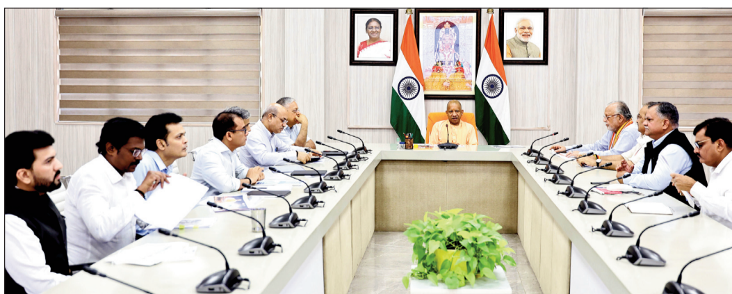
रोजगार और 05 गीगावॉट ए0आई0 कम्प्यूट कॉरिडोर विकसित करने का लक्ष्य रखा गया है। वर्ष 2040 तक दुनिया की नई अर्थव्यवस्था ए0आई0, क्लाउड, साइबर सिस्कोरिटी, सेमीकण्डक्टर, इलेक्ट्रिक

बुन्देलखण्ड औद्योगिक विकास प्राधिकरण (बीडा) क्षेत्र से की जा सकती है, जहाँ बड़े पैमाने पर भूमि उपलब्ध है। डाटा समूह सहित बड़ी टेक कम्पनियों से संवाद स्थापित कर लखनऊ को ए0आई0 सिटी के रूप में विकसित करने की दिशा में कार्य किया जाए। बैठक में मुख्यमंत्री को अवगत कराया गया कि उत्तर प्रदेश डाटा सेंटर क्लस्टर, प्रदेश को भारत और ग्लोबल साउथ का सबसे बड़ा ए0आई0 कम्प्यूट पावर सेंटर बनाने की दीर्घकालिक रणनीति है। इसका उद्देश्य उत्तर प्रदेश को आर्टिफिशियल इंटेलिजेंस, डेटा सेंटर, क्लाउड इन्फ्रास्ट्रक्चर और हाई-टेक डिजिटल नैचुरैफैक्टरिंग का वैश्विक केन्द्र बनाना है। यह केवल एक परियोजना नहीं, बल्कि अगले 50 वर्षों के लिए उत्तर प्रदेश की नई आर्थिक संरचना का खाका है। इसके तहत नई आर्थिक संरचना का खाका है। इसके तहत वर्ष 2040 तक 05 लाख करोड़ डॉलर की अर्थव्यवस्था, 1.5 लाख से अधिक प्रत्यक्ष