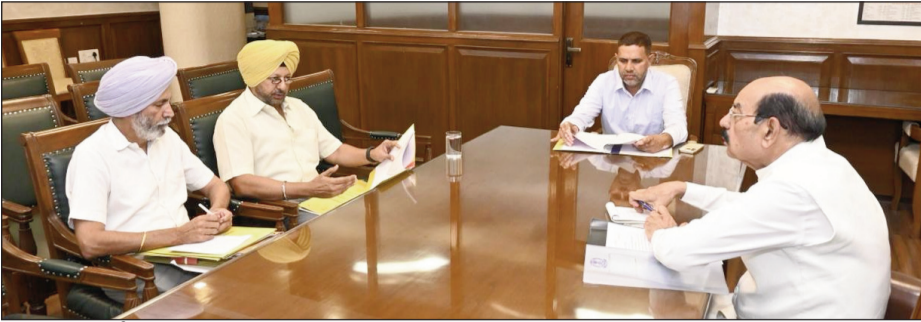
सिटी दर्पण संवाददाता चंडीगढ़

मुख्यमंत्री भगवंत सिंह मान के नेतृत्व वाली पंजाब सरकार पूर्व सैनिकों और उनके परिवारों के कल्याण तथा पुनर्वास के लिए तेजी से कार्य कर रही है। रक्षा सेवाएं कल्याण मंत्री मोहिंदर भगत ने अधिकारियों को पंजाब एक्स-सर्विसमेन कॉर्पोरेशन (पेस्को) को और मजबूत बनाने के लिए टोस कदम उठाने के निर्देश दिए हैं, ताकि पूर्व सैनिकों और उनके परिवारों को बेहतर रोजगार अवसर और कल्याणकारी योजनाओं का लाभ प्रदान किया जा सके। पंजाब सिविल सचिवालय में आयोजित समीक्षा बैठक की अध्यक्षता