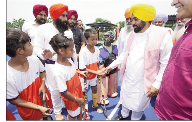
सरकार के अथक प्रयासों से 21 लाख क्यूबिक मीटर भूजल रिचार्ज हुआ है और पानी के स्तर में 2 से 4 मीटर की बढ़ोतरी हुई है: मुख्यमंत्री

पंजाब के मुख्यमंत्री भगवंत सिंह मान ने आज संत बाबा अवतार सिंह जी की 38वीं सालाना बरसी संबंधी आयोजित सामाजिक दौरेन गांव सीचेवाल में माथा टेका। इस मौके पर एक प्रगतिशील और आत्मनिर्भर पंजाब का सपना देखते हुए भगवंत सिंह मान ने राज्यसभा सदस्य संत बलवीर सिंह सीचेवाल के साथ संत अवतार सिंह मेमोरियल हॉकी स्टेडियम में एक नए एस्टोटर्फ का उद्घाटन किया। आम आदमी पार्टी (आप) सरकार की ओर से खेल बुनियादी ढांचे, सिंचाई, भूजल रिचार्ज और लोक कल्याण संबंधी किए गए उपायों को उजागर करते हुए मुख्यमंत्री भगवंत सिंह मान ने कहा कि सरकार ने खेतों तक 21,000 क्यूबिक पानी पहुंचाया है, जो दो लाख नहरों के बराबर है। पर्यावरण अनुकूल उपायों से 21 लाख क्यूबिक मीटर पानी भूमिगत रिचार्ज करने में मदद मिली है, जिससे कई क्षेत्रों में पानी के स्तर में 2 से 4 मीटर की बढ़ोतरी हुई है। उन्होंने कहा कि पंजाब विश्व स्तरीय सरकारी स्कूलों, अस्पतालों, सड़कों और खेल सुविधाओं के माध्यम से तेजी से प्रगति कर रहा है। उन्होंने आगे कहा कि एक जीवंत हरणाल पंजाब के रंग अब पूरे राज्य में दिखने शुरू हो गए हैं। इस मौके पर भारी भीड़ को संबोधित करते हुए मुख्यमंत्री भगवंत सिंह मान ने कहा, पंजाब की धरती बहुत उपजाऊ है और यहां नफरत और वैर के