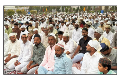
जामा मस्जिद के पास मंदिर और गुरुद्वारा देखकर उन्हें बेहद खुशी होती है। चंडीगढ़ के सेक्टर 29 स्थित मस्जिद में नमाज के बाद लोगों ने एक-दूसरे से गले मिलकर बकरीद की बधाई दी। साथ ही मुस्लिम समाज के कुछ प्रतिनिधियों व स्थानीय लोगों ने सरकार से गाय को राष्ट्रीय पशु घोषित करने की मांग की। उनका कहना था कि गाय भारतीय संस्कृति और आस्था का महत्वपूर्ण प्रतीक है, इसलिए इसके संरक्षण के लिए प्रभावी नीति बनाई जानी चाहिए।