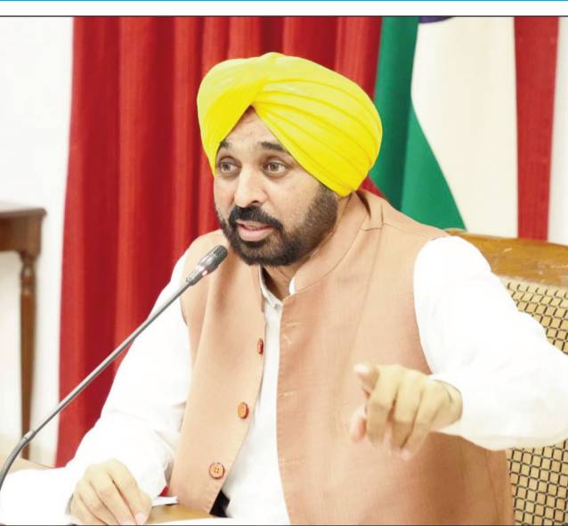
के अनुसार वारिश, मच्छरों की बढ़ती संख्या और स्थानीय स्वच्छता की स्थितियों के अनुसार मौसमी प्रकोप तेजी से बदल सकते हैं।

30.47 लाख रुपये के दावे किए गए। निमोनिया के 377 मामलों पर 11.06 लाख रुपये, जबकि एक्यूट ब्रॉकाइटिस के 326 मामलों पर 9.24 लाख रुपये खर्च हुए। वहीं मानसून के दौरान अक्सर चर्चा में रहने वाली बीमारियों के मामले तुलनात्मक रूप से कम रहे। डेंगू के केवल 12 मामले दर्ज हुए, जिन पर 40,880 रुपये का दावा हुआ। मलेरिया के सिर्फ 3 मामले, चिकनगुनिया के 6 मामले और हीट स्ट्रोक के 4 मामले सामने आए, जो यह दर्शाते हैं कि इस अवधि के दौरान अत्यधिक गर्मी से संबंधित अस्पताल में भर्ती होने के मामले तुलनात्मक रूप से कम हैं। हालांकि, जन स्वास्थ्य विशेषज्ञ किसी भी प्रकार की लापरवाही से बचने की सलाह दे रहे हैं। नेशनल इंस्टीट्यूट ऑफ हेल्थ के एक अध्ययन