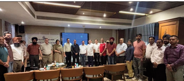
आगामी मानसून सीजन की तैयारियों पर विशेष जोर दिया गया। बिल्डरों को सलाह दी गई कि वे वर्षा जल संचयन गड्डों (रेनवॉटर हार्वेस्टिंग पिट्स) की सफाई करवाएं और यह सुनिश्चित करें कि भूजल की गुणवत्ता को सुरक्षित रखने के लिए रिचार्ज प्रणालियों में केवल सतह का साफ पानी ली जाए। बोर्ड ने सीवेज ट्रीटमेंट प्लांटों (एस.टी.पी.) को सही तरीके से संचालित करने, उपचारित पानी की ड्रूल् फ्लॉविंग और बागवानी में उपयोग

उद्देश्य केवल कानून लागू करना ही नहीं, बल्कि बेहतर तालमेल और पारदर्शिता के माध्यम से पर्यावरण-अनुकूल और टिकाऊ शहरी विकास में सहायता करना भी है। बैठक के दौरान एस.ई.ई. ने परियोजनाओं के निर्माण और उनके संचालन (ऑपरेशनल) दोनों चरणों के दौरान पर्यावरण क्लीयरेंस (ई.सी.) की शर्तों का पालन करने के महत्व पर बल दिया। उन्होंने सलाह दी कि निर्माण चरण के दौरान पर्यावरण नियमों को बड़े बोर्डों पर प्रदर्शित किया जाए ताकि वहां कार्यरत स्टाफ और मजदूरों को इन नियमों को लागू करने की लगातार याद बनी रहे। बिल्डरों को प्रेरित किया गया कि वे किसी तीसरे पक्ष (एजेंटों) पर पूरी तरह निर्भर रहने के बजाय आवेदन फार्मों को स्वयं पढ़ें, समझें और सही तरीके से भरें, ताकि आपसी समन्वय बेहतर हो सके और नियमों के पालन की प्रक्रिया आसान बने।